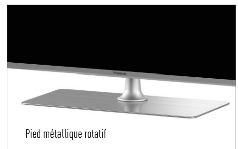
Pied métallique rotatif