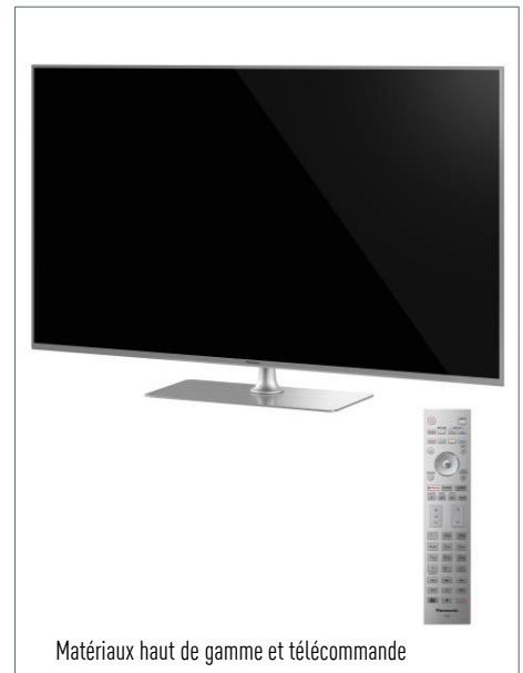
Matériaux haut de gamme et télécommande métallique

Multi HDR Ultimate – Compatible avec tous les principaux formats HDR tels que HDR10/PQ, HLG, HDR10+, Dolby Vision et HLG Photo